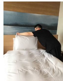
剥がすことも力のいる大変なお仕事です