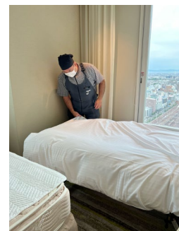
狭いところも上手に整えます