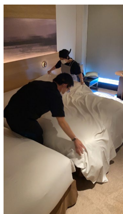
仲間と協力して作業